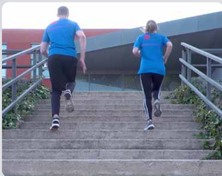
Subir escaleras a diferentes velocidades