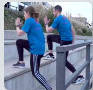
Subir escalón y lanzamiento pierna